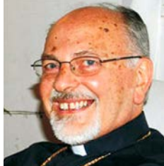
Mons. Paolo Urso (Vescovo Emerito)